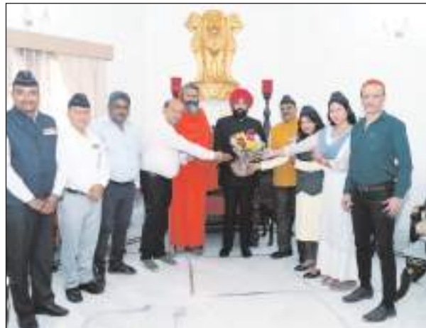
गतिविधियों के बारे में जानकारी ली।

8 राज्यपाल ने होली की बधाई और शुभकामनाएं दी और शाखा के क्रिया कलापों के बारे में जानकारी ली