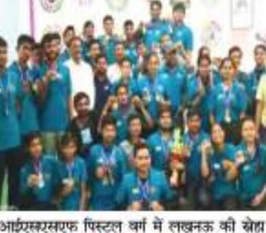
आईएसएसएफ पिस्टल वर्ग में लखनऊ की श्रेण