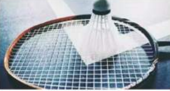
होगा। महिलाओं के उबेर कप में, 15 बल्ले के चैंपियन चीन को रफ ए में भारत, कनाडा और सिंगापुर से पिटुना है। रफ बी में थाईलैंड, चीनी

गणराज्य शामिल होंगे, जबकि रफ डी में डेनमार्क का रहमना मलेशिया, अल्जेरिया और हांगकांग, चीन से ताइपे, मलेशिया और ऑस्ट्रेलिया शामिल है। जापान, यूएई, हांगकांग चीन